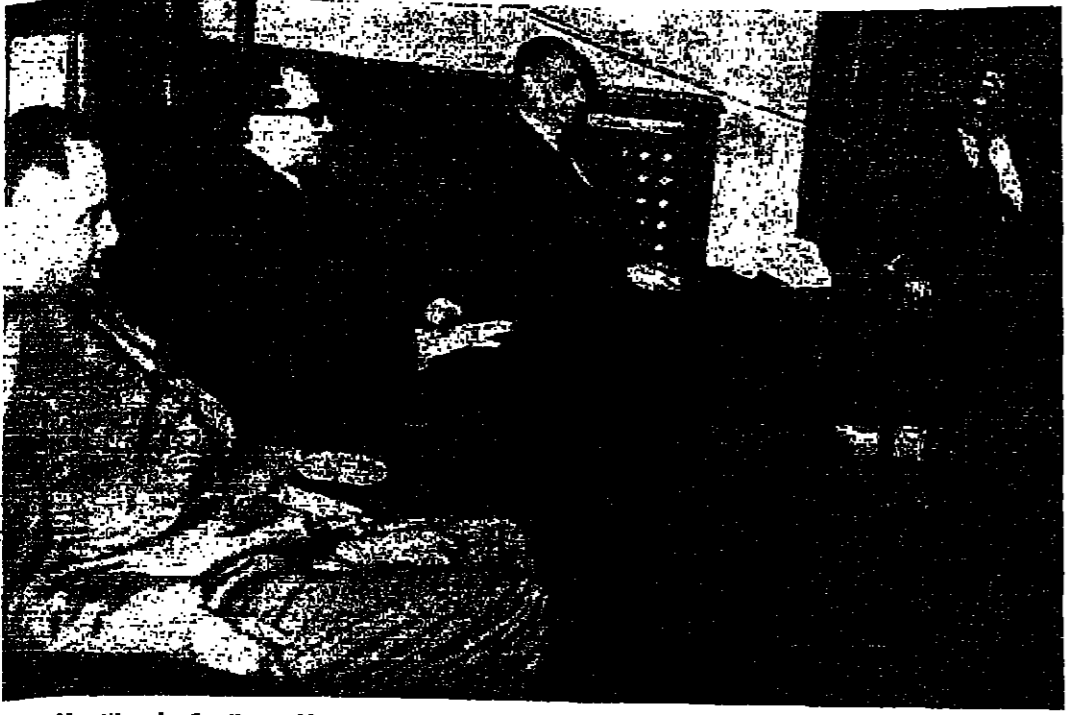
دولة السيد بخت الطائفي رئيس الوزراء لدى اجتماعه بالمستر جورج بول القنصل الفرنسي لدى الامم المتحدة بحضور السيد عبد الحميد الباقاوي وزير الخارجية والمختار محمد الصرايمون وزير الدفاع لدى الامم المتحدة